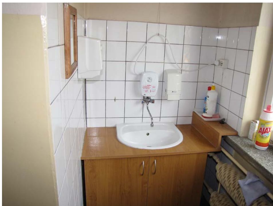
FOT.10 Widok części sanitarnej