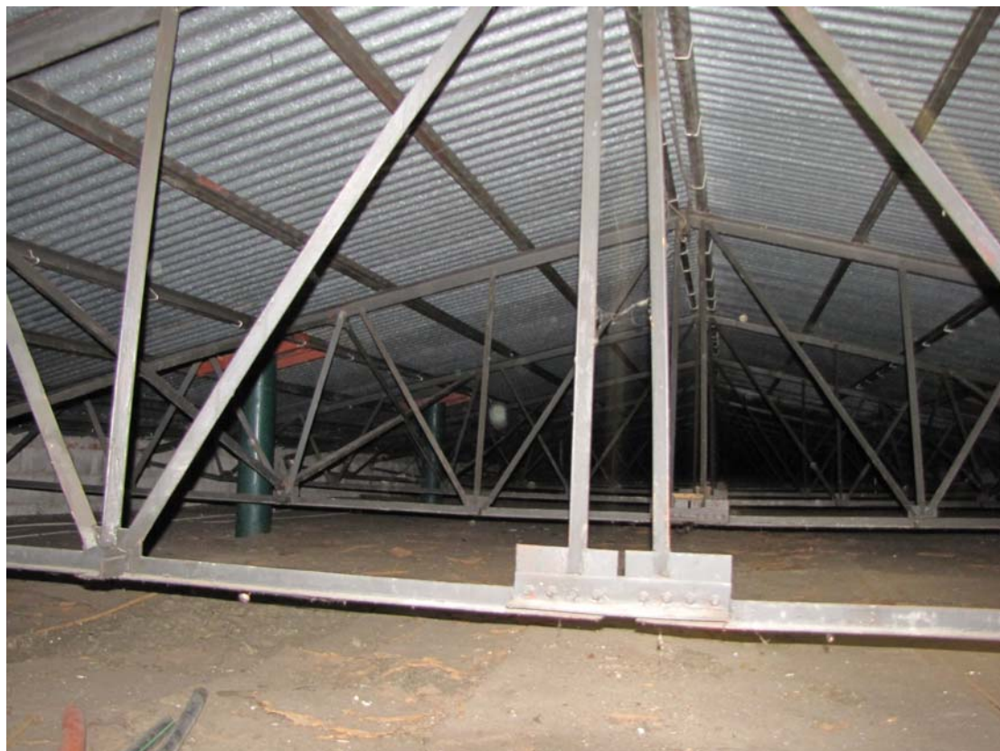
FOT.15 widok konstrukcji stalowej przekrycia