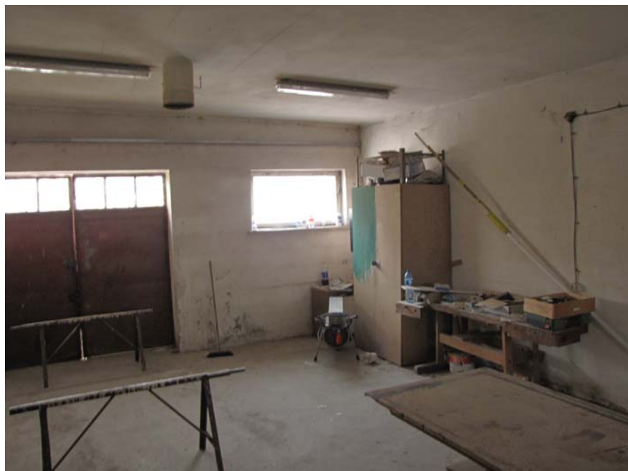
FOT.11 Widok typowego pomieszczenia magazynowego ( ZDJĘCIE – AUTOR)