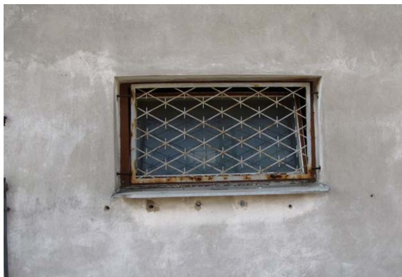
OK-3 - Okno drewniane z kratą stalową