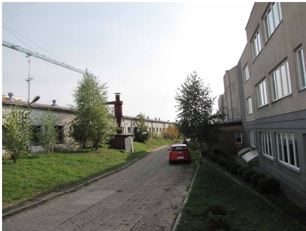
FOT.3 Elewacja południowa cz.2 ( ZDJĘCIE – AUTOR)