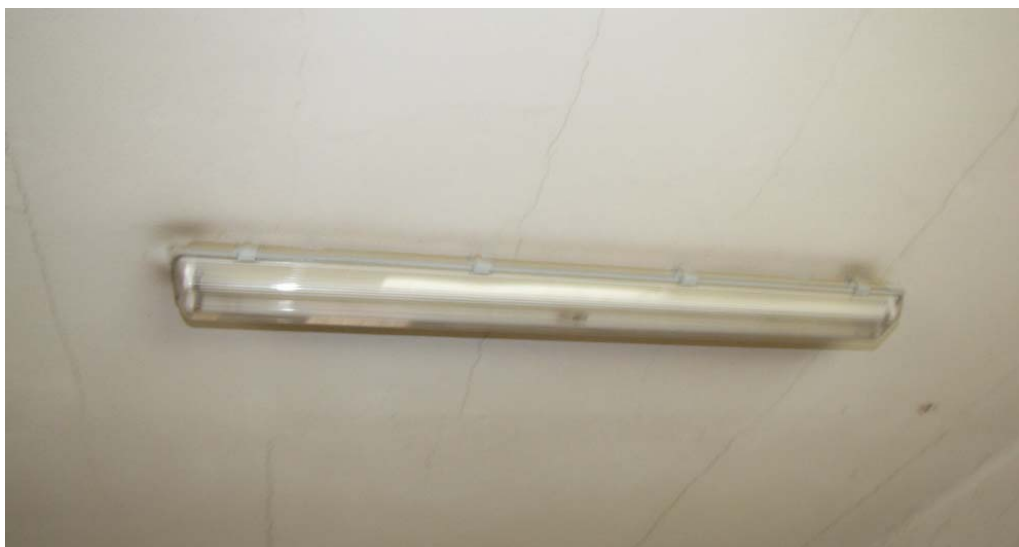
Oprawa oświetleniowa OP-2