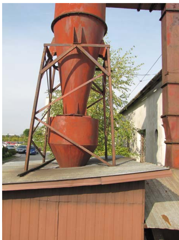
FOT.4 Elewacja południowa – urządzenie do demontażu