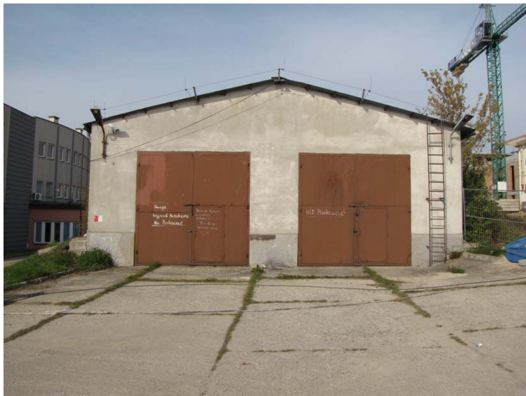
FOT.5 Elewacja wschodnia ( ZDJĘCIE – AUTOR)