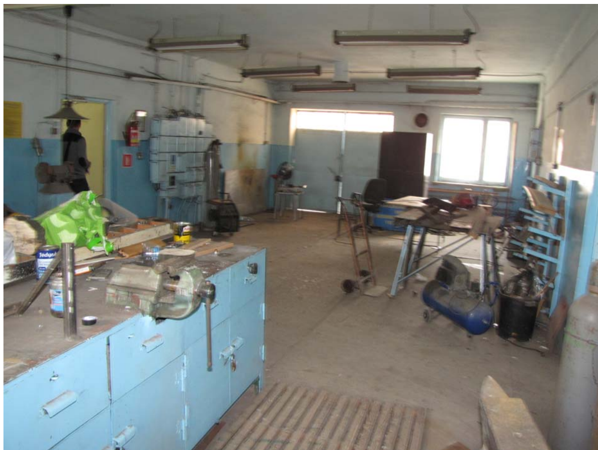
FOT.12 Pomieszczenia warsztatowe ( ZDJĘCIE – AUTOR)