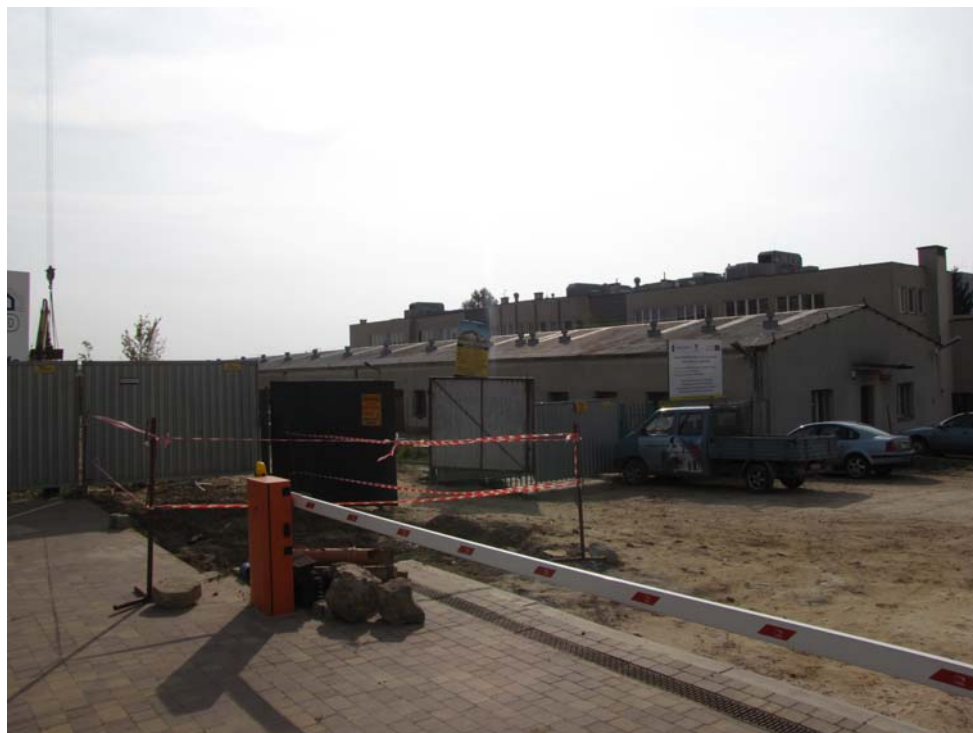
FOT.7 Widok północno – zachodni ( ZDJĘCIE – AUTOR)