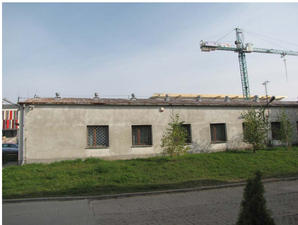
FOT.2 Elewacja południowa cz.1 ( ZDJĘCIE – AUTOR)