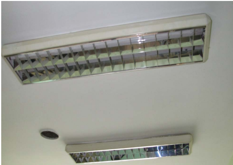
Oprawa oświetleniowa OP-1