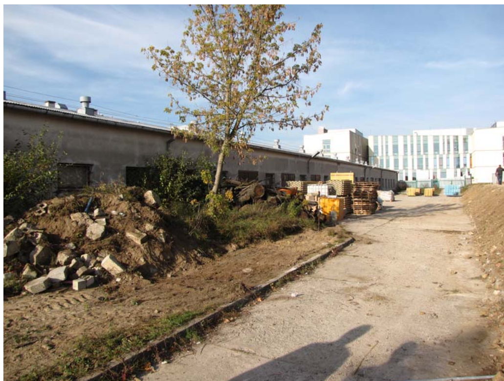
FOT.6 Elewacja północna( ZDJĘCIE – AUTOR)