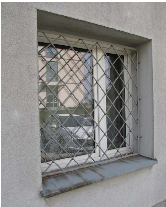
OK-1 - Okno PCV z kratą stalową