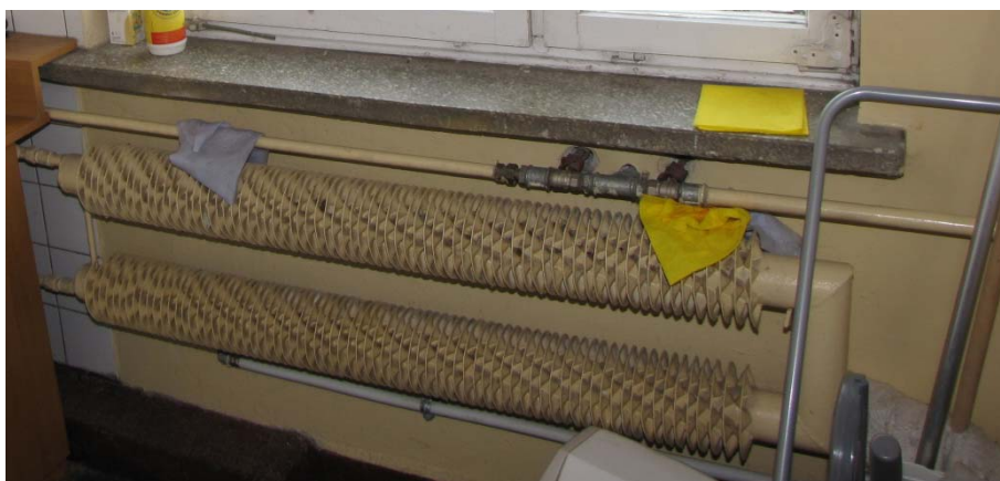
Grzejnik G1 - stalowy rurowo-żebrowy