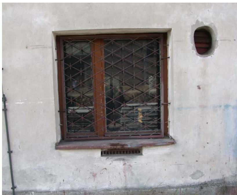
OK-2 - Okno drewniane z kratą stalową