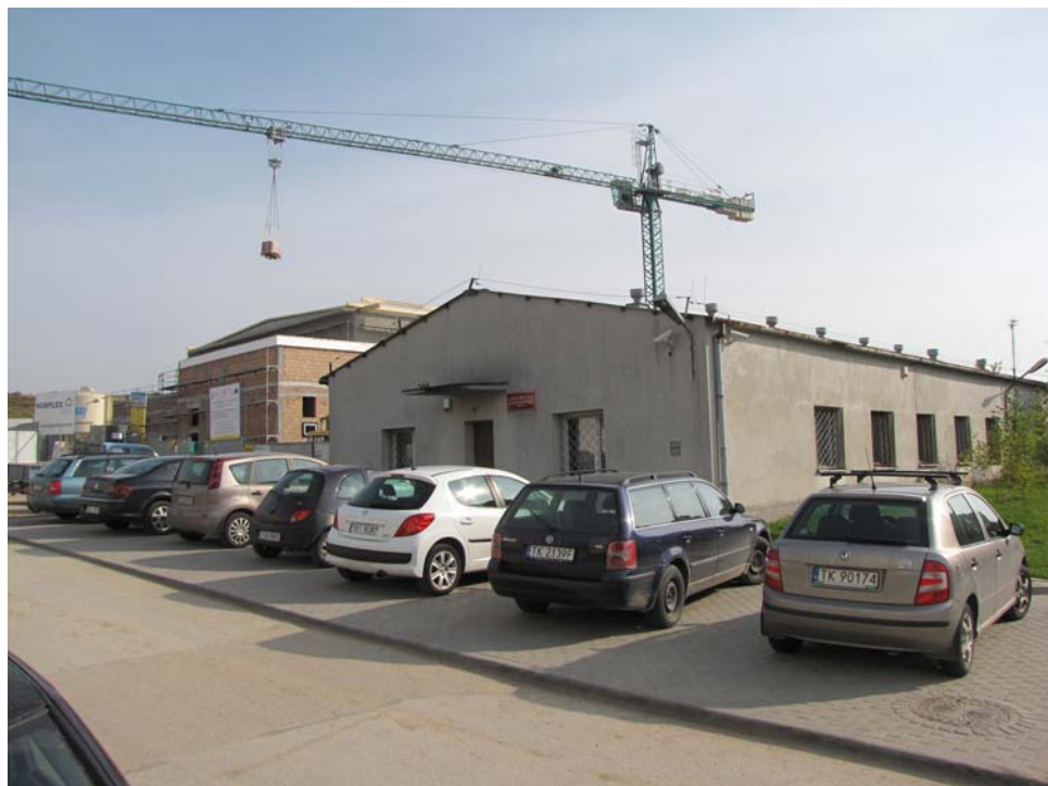
FOT.1 Wejście do budynku ( ZDJĘCIE – AUTOR)