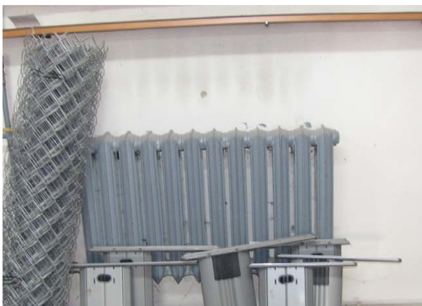
Grzejnik G2 – członowy, żeliwny