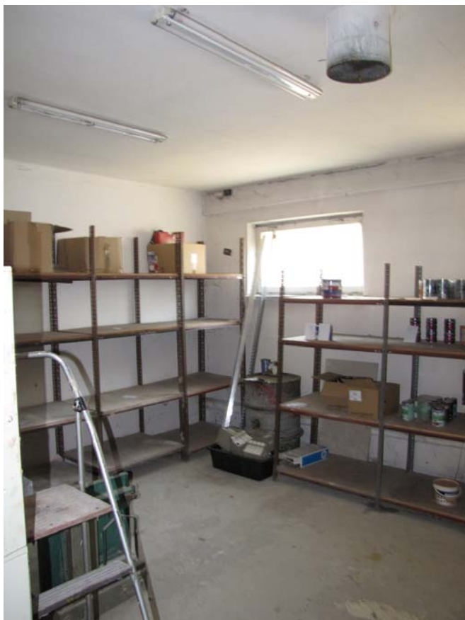
FOT.13 Pomieszczenie magazynowe( ZDJĘCIE – AUTOR)