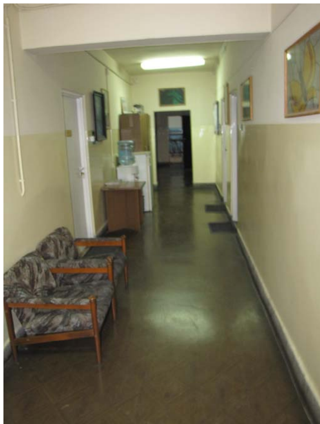
FOT.8 Widok korytarza części biurowej