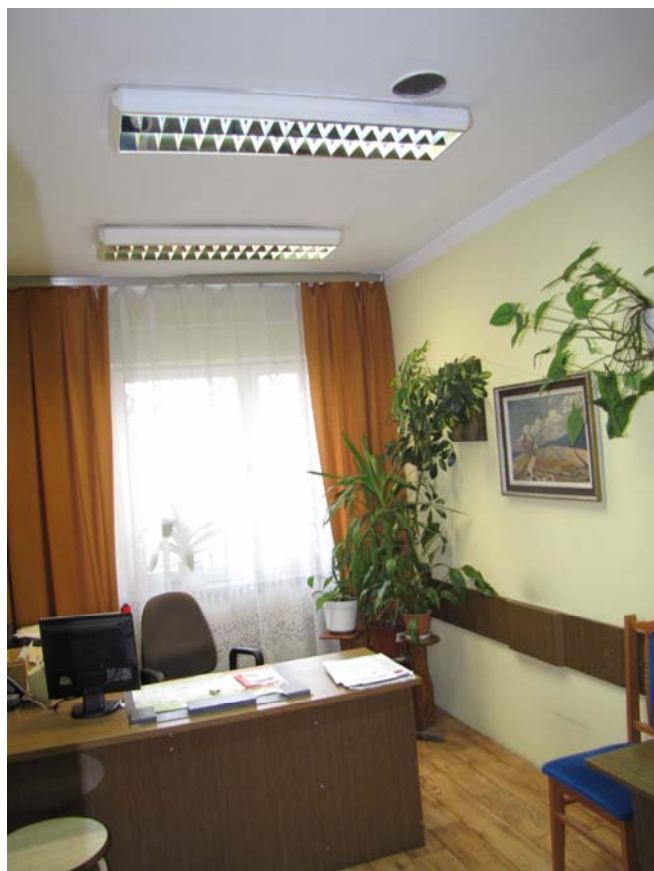
FOT.9 Typowy pokój biurowy( ZDJĘCIE – AUTOR)