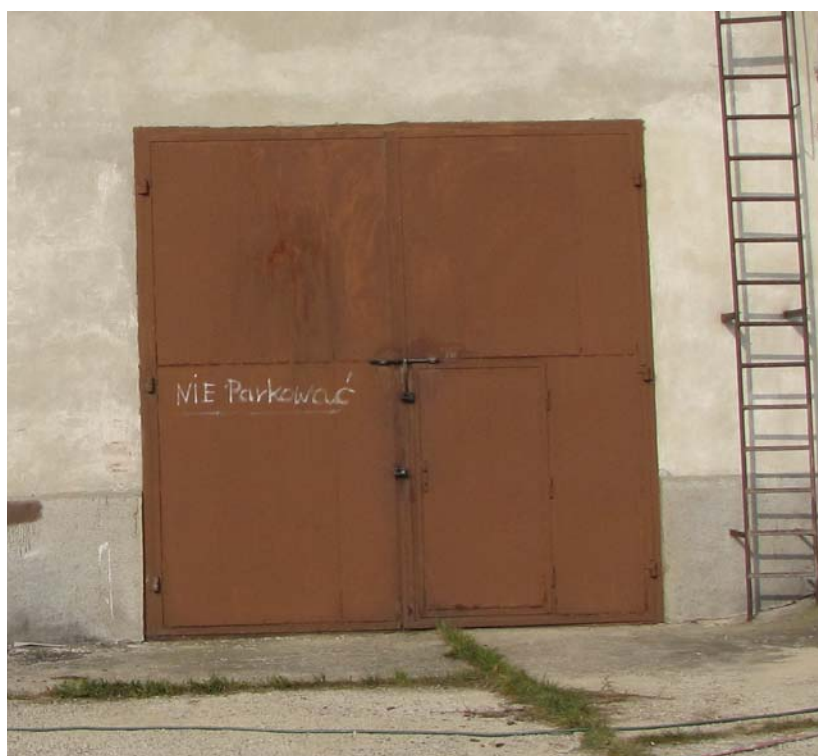
Br2 – Brama stalowa