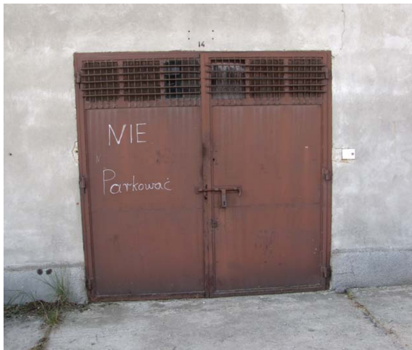
Br1 – Brama stalowa z naświetlem