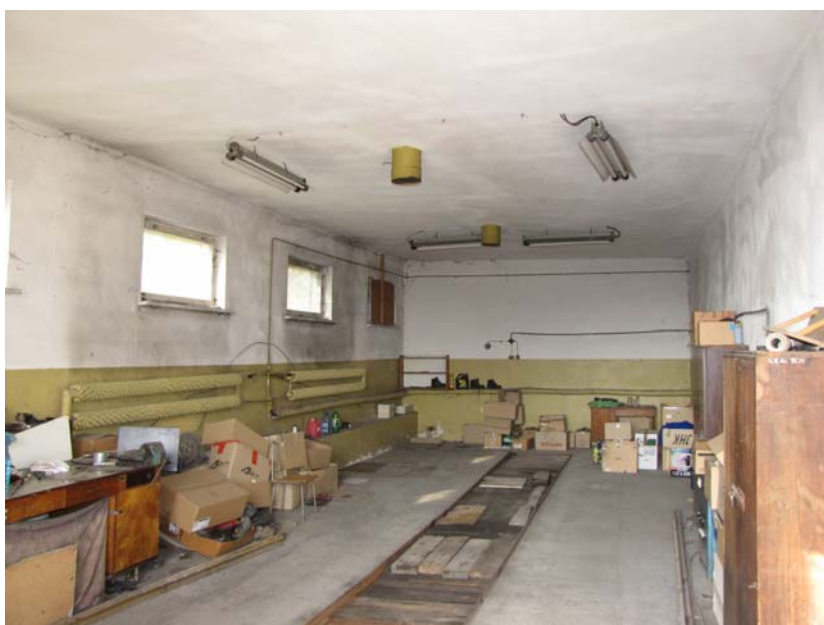
FOT.14 Pomieszczenie garażowe( ZDJĘCIE – AUTOR)