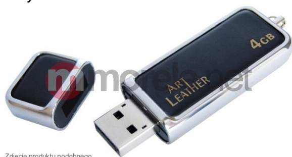
Zdjęcie produktu podobnego